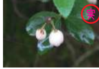
シラタマノキ 白玉の木