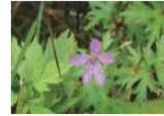
ハクサンフウロ 白山風露