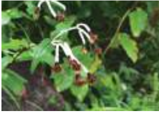
チョウジギク 丁字菊

8月27日現在、自然園内にみられる花と実の特集！ イワショウブは白色から赤色に変化していく時がきれいですよ！