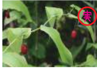
オオバタケシマラン 大葉竹結欄