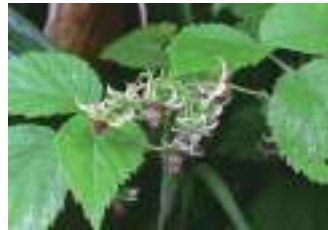
シナ/キイチゴ 信濃木莓