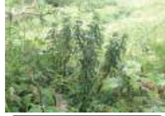
タカトウダイ 高燈台