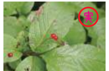
オオヒョウタンボク 大瓢箪木