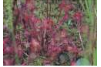
モウセンゴケ 毛氈苔