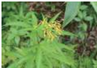
ハンゴンソウ 反魂草