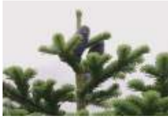
オオシラビソ 大白檜曾