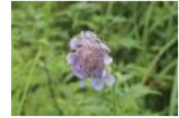
マツムシソウ 松虫草