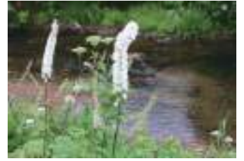
サラシナショウマ 晒菜升麻