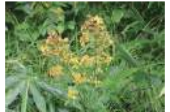
ミヤマアキ/キンソウ 深山秋の麒麟草