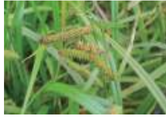
オオカサスゲ 大笠菅