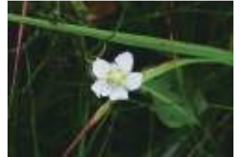
ウメバチソウ 梅鉢草