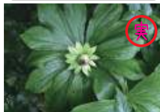
キヌガサソウ 衣笠草