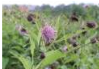
タテヤマアザミ 立山薊