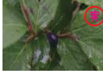
オオバスの木 大葉酢の木