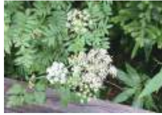
ミヤマセンキュウ 深山川芎