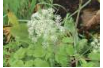
オオバセンキュウ 大葉川芎