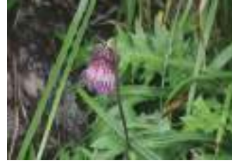
ダイニチアザミ 大日薊