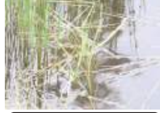
ホソバタマミクリ 細葉玉実栗