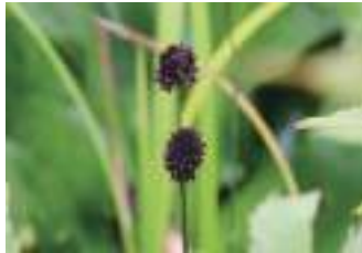
ミクリゼキシヨウ 栗石菖