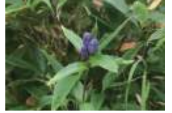
オヤマリンドウ 雄山竜胆