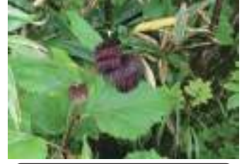
オヤマボクチ 雄山火口