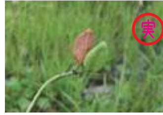
ニッコウキスゲ 日光黄菅