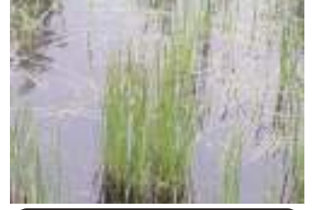
ミヤマホタルイ 深山螢蘭