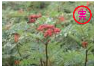
ウラジロナナカマド 裏白七竈