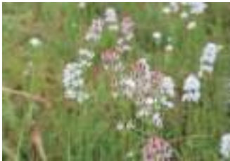
イワショウブ 岩菖蒲