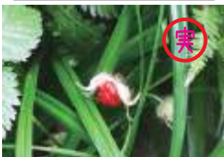
ゴヨウイチゴ 五葉莓