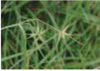
ミタケスゲ 御岳菅

マイヅルソウの実が、まだら模様で綺麗ですね。梅の森ではマツムシソウが咲き始めました。