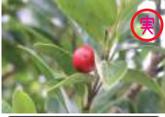
アカミノイヌツゲ 赤実の犬黄楊