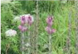
オニシオガマ 鬼塩竈