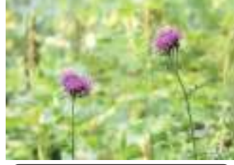
タムラソウ 田村草