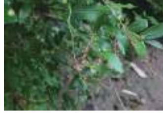
ハナヒリノキ 嚏の木