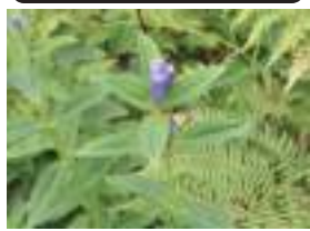
オヤマリンドウ 雄山竜胆