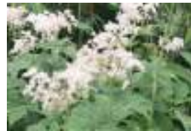
オニシモツケ 鬼下野