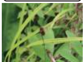
ミクリゼキシヨウ 実栗石菖