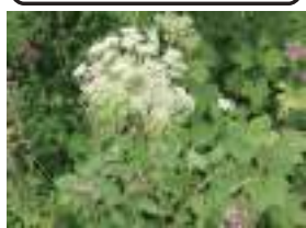
オオバセンキュウ 大葉川芎