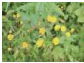
かんじょうぎ 寒地髪剃菜