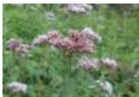
ヨツパヒヨドリ 四葉鶯