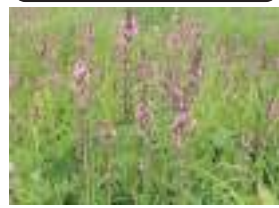
オニシオガマ 鬼塩竈