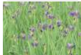
ヒオウギアヤメ 檜扇菖蒲