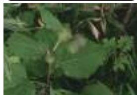
オヤマボクチ 雄山火口