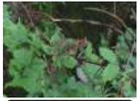
クロクモソウ 黒雲草