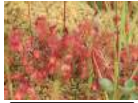
モウセンゴケ 毛氈苔