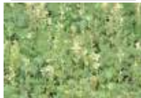
エゾシオガマ 蝦夷塩竈