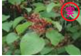
オオカメノキ 大亀の木