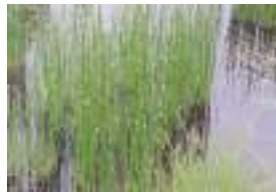
ミヤマホタルイ 深山螢蘭