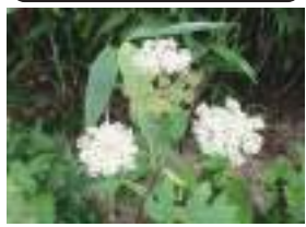
オオハナウド 大花独活