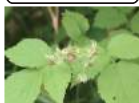
シノキイチブ 信濃木苺