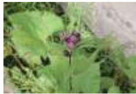
クロトウヒレン 黒唐飛廉