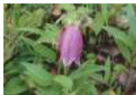
ヤマホタルブクロ 山螢袋