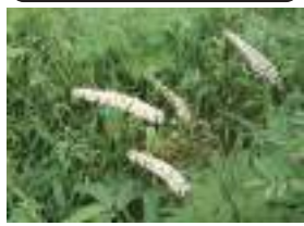
サラシナショウマ 晒菜升麻