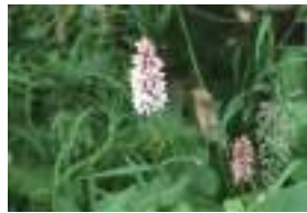
イブキトラノオ 伊吹虎の尾