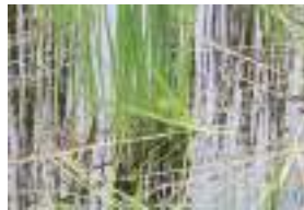
ホソバタマミクリ 細葉球実栗