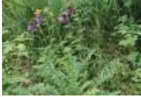
ダイニチアザミ 大日薊