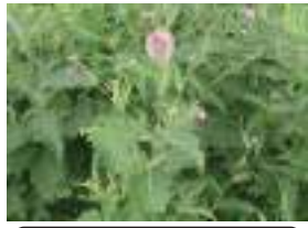
タテヤマアザミ 立山薊