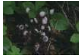
ギンリョウソウ 銀竜草