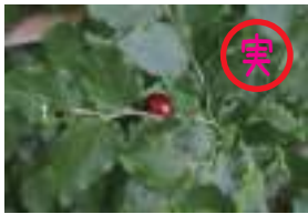
アオジクスノキ 青軸酢の木