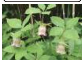
ツルニンジン 蔓人參