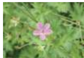
ハクサンフウロ 白山風露