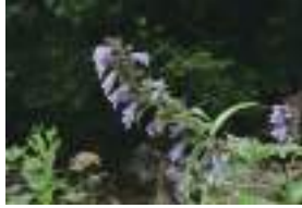
ミソガワソウ 味噌川草