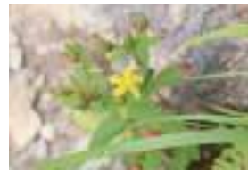
オトギリソウ 弟切草