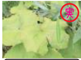
サンカヨウ 山苧葉