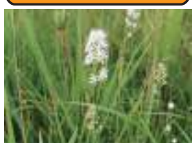
イワショウブ 岩菖蒲