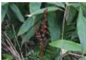
オニノヤガラ 鬼の矢柄