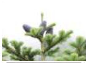
オオシラビソ 大白檜曾