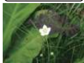
ウメバチソウ 梅鉢草