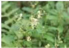
ミヤマホツツジ 深山穂躑躅