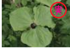
エンレイソウ 延齢草