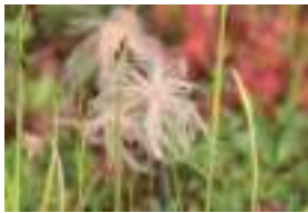
クングルマ 稚児草(果穂)