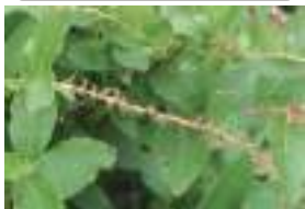
ハナヒリノキ 噓の木