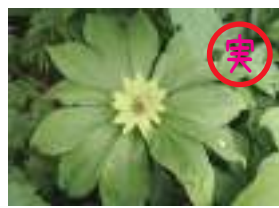
キヌガサソウ 衣笠草