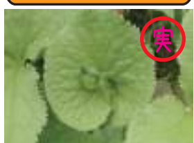
シラネアオイ 白根葵