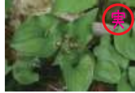
マイヅルソウ 舞鶴草