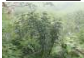
タカトウダイ 高燈台