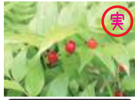
タケシマラン 竹綺欄