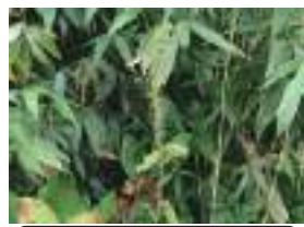
バイケイソウ 梅蕙草