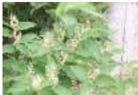
ウラジロタデ 裏白蓼