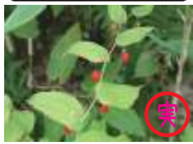
オオバタケシマラン 大葉竹綺欄