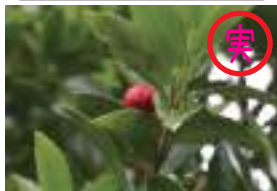
アカミノイヌツゲ 赤実の犬黄楊