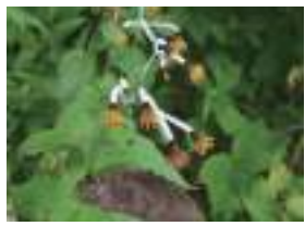
チョウジギク 丁字菊