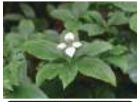
ゴゼンタチバナ 御前橘