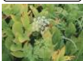
ミヤマセンキュウ 深山川芎