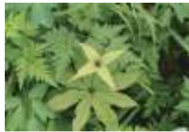
クルマツクハネノキ 車葉衝羽根草