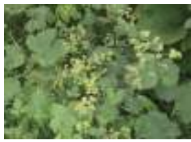
ハゴロモグサ 羽衣草

8月13日現在、トリカブト、ツルニンジンなど秋を感じる花が咲き始めました。色とりどりの実も増えてきました。