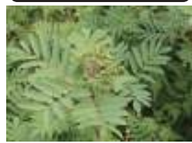
ウラジロナナカマド 裏白七竈