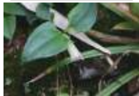
ツルリンドウ 蔓竜胆