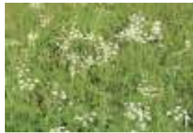
シラネニンジン 白根人参