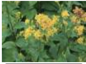
ミヤマキノキリンソウ 深山秋の麒麟草