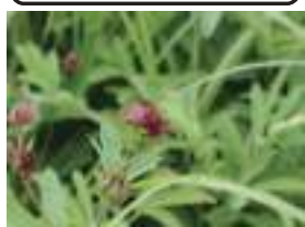
クロパンロウガ 黒花狼牙