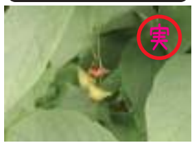
クロツリバナ 黒吊花