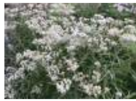
ヤマハハコ 山母子