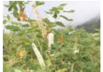
サラシナショウマ 晒菜升麻