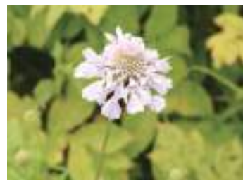
マツムシソウ 松虫草