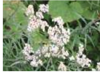
ヤマハハコ 山母子