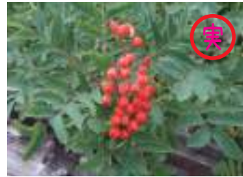
ウラジロナカマド 裏白七竈