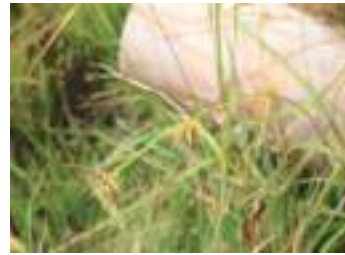
ミタケスゲ 御岳菅