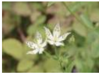
アケボノソウ 曙草