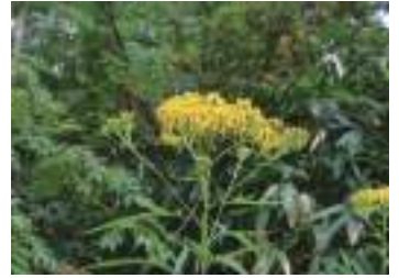
ハンゴンソウ 反魂草