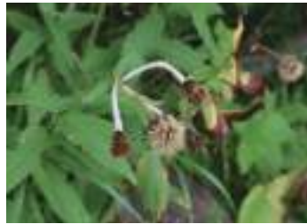
チョウジギク 丁字菊