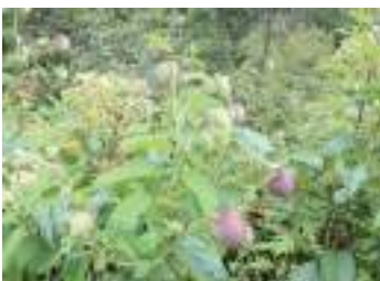
オヤマボクチ 雄山火口