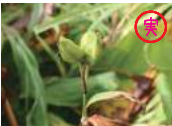
ニッコウキスゲ 日光黄菅