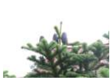
オオシラビソ 大白檜曾