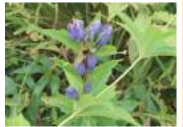
オヤマリンドウ 雄山竜胆