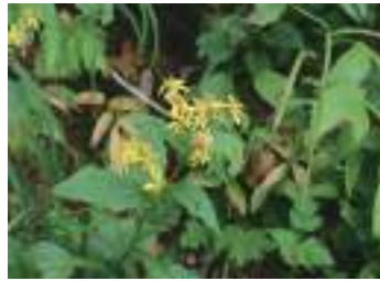
シヤマアキ/キリンソウ 深山秋の麒麟草