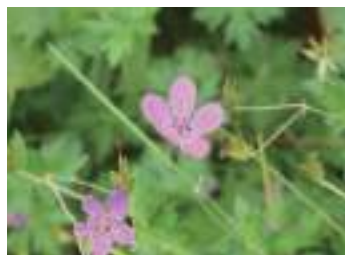
ハクサンフウロ 白山風露