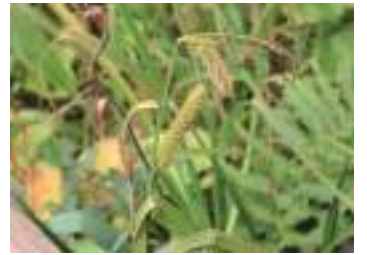
オオカサスゲ 大笠菅