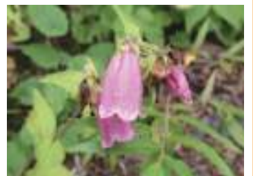
ヤマホタルブクロ 山螢袋