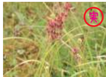
イワショウブ 岩菖蒲