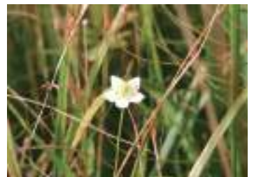
ウメバチソウ 梅鉢草