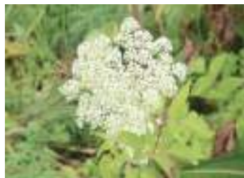
オオバセンキュウ 大葉川芎