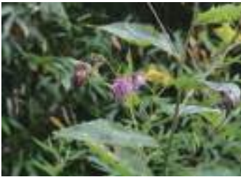
タテヤマアザミ 立山薊