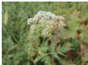
ミヤマセンキュウ 深山川芎